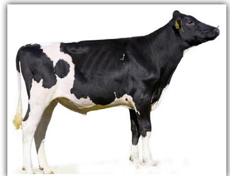
EM DESTAQUE O TOURO DG HAROLD P-ET