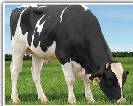
EM DESTAQUE O ANIMAL AX162402 - S-S-I LARSACRES G STRATA-ET